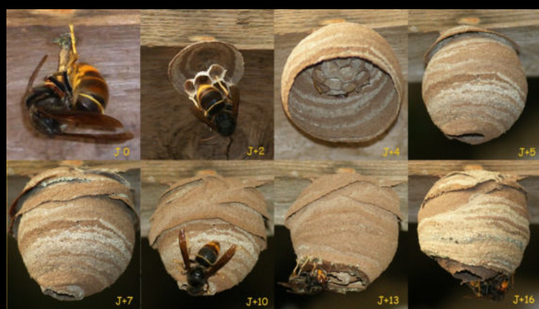
NIDS PRIMAIRES (faciles à détruire)

Le piégeage préventif n'est pas recommandé (risque pour autres insectes) et est réservé aux apiculteurs.